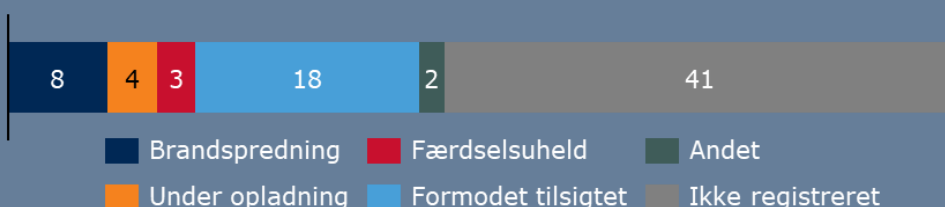
Figur 2: Registrerede påvirkninger ved brande i el- og hybridbiler, 2018-juni 2023 (n=76)

I svenske MSB's opgørelse af el- og hybridbilsbrande for 2018-2022 var 18 af 81 biler under opladning på brandtidspunktet.